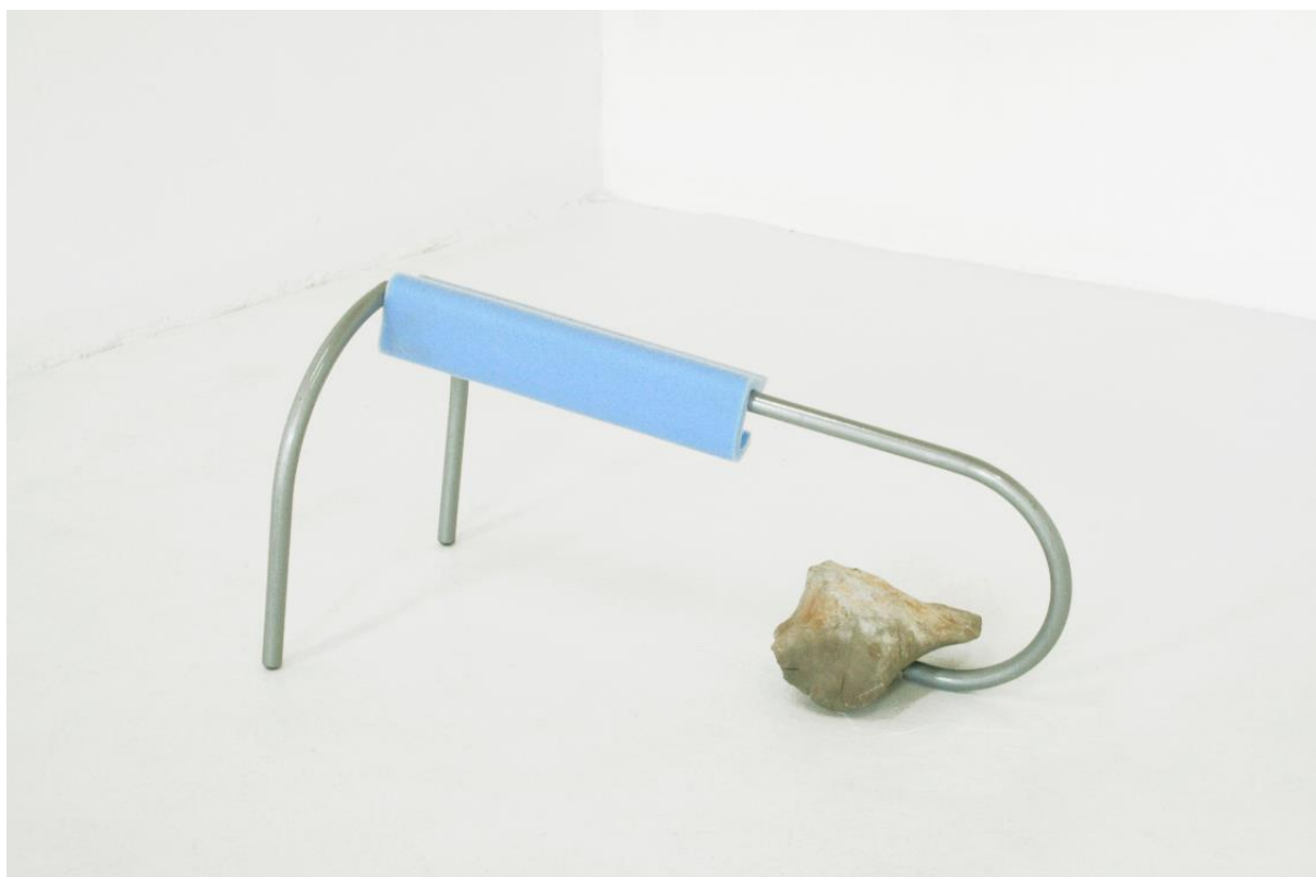
Mit Borrás. Ergonomic Forms as Precarious Models of Adaptation, 2017.

En el proceso creativo del artista la idea de cueva es un concepto presente. Cueva como refugio del hombre del siglo XXI que se rodea de objetos de consumo, como los primeros habitantes de la tierra se servían de elementos básicos para su vida cotidiana. Los palos y las piedras de los refugios prehistóricos son ahora láminas finas de plástico transparente, esponjas sintéticas, materiales translúcidos de rosa cuarzo y azul serenidad, según el sistema Pantone. El espacio que para los primeros hombres jugaba un papel protector es, en la actualidad, un lugar para el ocio y el relax, fresco, moderno y perfectamente reglado; una cavidad suave donde poder sentir el placer que nos produce la vida en la naturaleza pero sin la naturaleza. Hoy existe una oferta masiva de objetos que ofrecen al consumidor experimentar sensaciones similares a las producidas en la naturaleza pero sin lo incómodo de ella, la parte más higiénica, la cara más aséptica y quirúrgica, el control de la temperatura de la luz, los aromas en los espacios colectivos para el tiempo libre, las gamas de colores utilizadas en nuestras casa. Las últimas obras de Mit Borrás nos llevan a entornos relacionados con el bienestar como parte de la industria del ocio. El yoga, la cromoterapia, el spa, lo deportivo y lo microperforado, lo azul y lo sagrado, lo espiritual y lo ancestral.